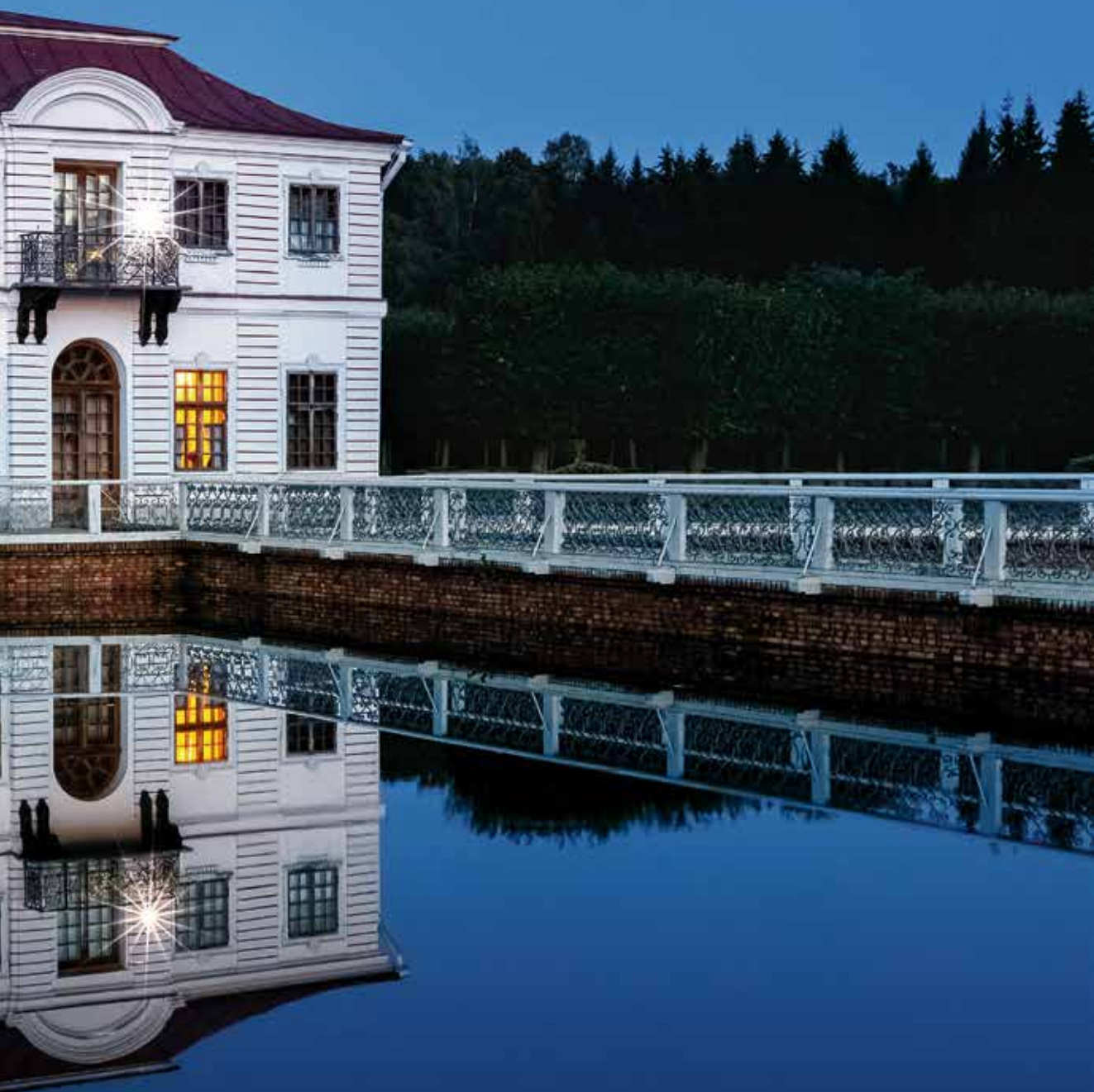
Дворец «Марли» в Нижнем парке