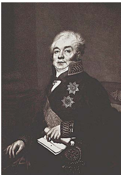
Граф Дмитрий Александрович Гурьев, управляющий Кабинетом Е. И. В. (1801–1825) Из издания: 200-летие Кабинета Его Императорского Величества. 1704–1904. СПб., 1911. ГМЗ «Петергоф». Инв. № ПДМП 279-рк

В 1809 году Императорский фарфоровый завод получил заказ Придворной конторы на исполнение парадного сервиза, которому суждено было стать самым известным русским ансамблем для накрытия столов во время приемов при императорском дворе. Управляющий Кабинетом Его Императорского Величества граф Д. А. Гурьев 2 докладывал о проделанной работе: «За минувший 1809й год Контора имеет честь представить при сем на благоусмотрение Кабинета Его Императорского Величества подробный отчет и краткий баланс по всем частям завода... В том же году завод имел щастие поднести Его Императорскому Величеству в числе прочих изделий своих полный десертный сервиз с изображением на оном Российских костюмов» 3 .