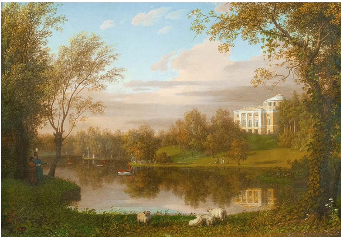
К.-Ф. Кюгельхен. Вид в Павловске. Россия. 1799–1801. Холст, масло. ГМЗ «Павловск». Инв. № ЦХ-1755-III

имеется одна бутылочная передача с монохромным изображением, а в ГРМ хранится сосуд с полихромной росписью по печати. Их можно датировать 1815 годом и отнести к первым примерам технического прогресса в фарфоровом производстве. Постепенно круг произведений для копирования на бутылочных передачах стал расширяться. На одной из передач соседствуют пейзаж с крепостью со стороны озера в Павловске по гравюре И. В. Ческого из серии «Виды пригородов и окрестностей Санкт-Петербурга» и ландшафт, окружающий дворец в Павловске со стороны Славянки, автор которого пока остается неизвестным. Наиболее близка последнему сюжету живописная панорама Павловского дворцово-паркового ансамбля, созданная К. Кюгельхеном около 1800 года, в которой открывающийся вид представлен в такой же перспективе, как и в резерве на бутылочной передаче. Однако все же следует отметить, что разница между творческой манерой этого художника и автора оригинала для копии на фарфоре очень велика.